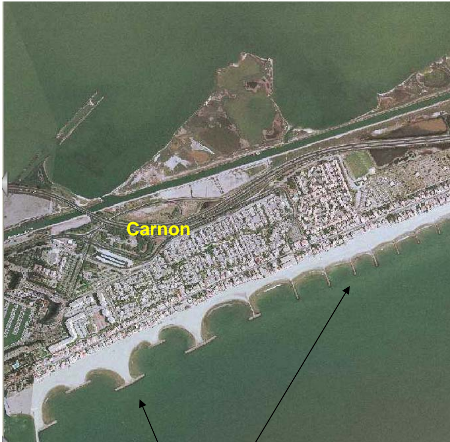
Enrochements de Carnon