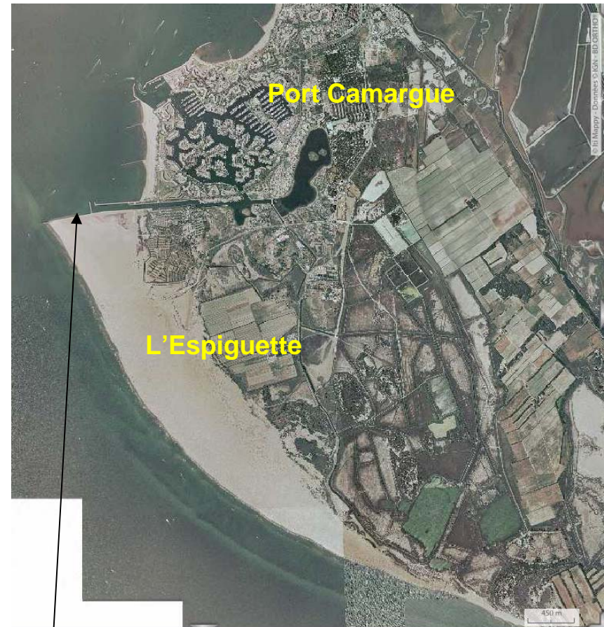
Digue de Port Camargue